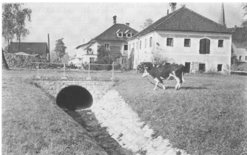
Mündung des Minithalbaches in den verrohrten Abschnitt. Das Schörgenhutnerhaus wurde mittlerweile abgetragen

Diese beiden Regulierungen verhindern in Zukunft, daß bereits bei mittlerem Hochwasser große Teile des Ortes sowie die nördlich anschließenden Talniederungen überschwemmt werden. Bis dahin