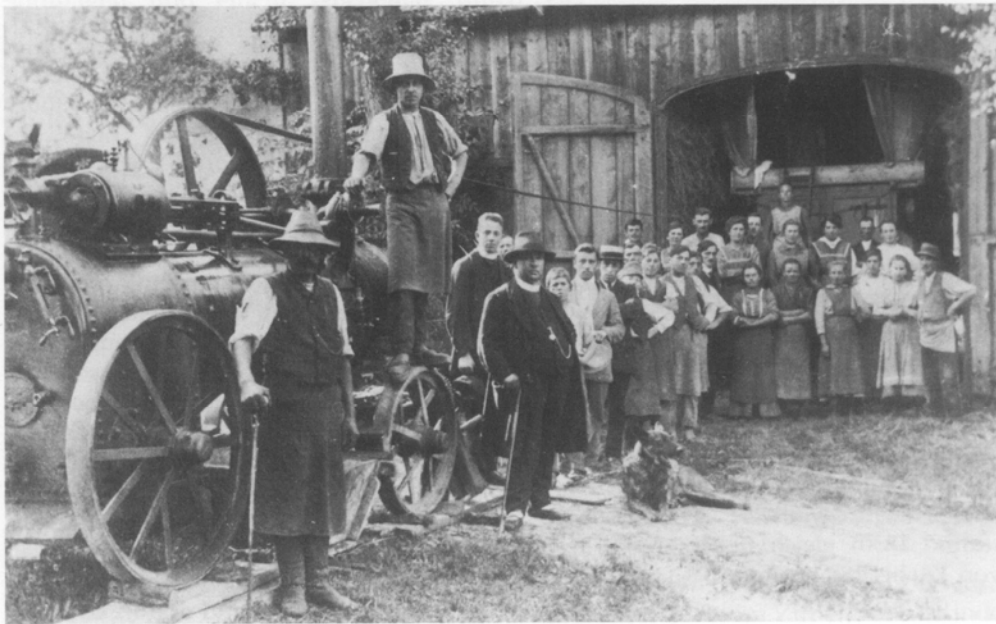
Drushtag um 1920 im Pfarrhof