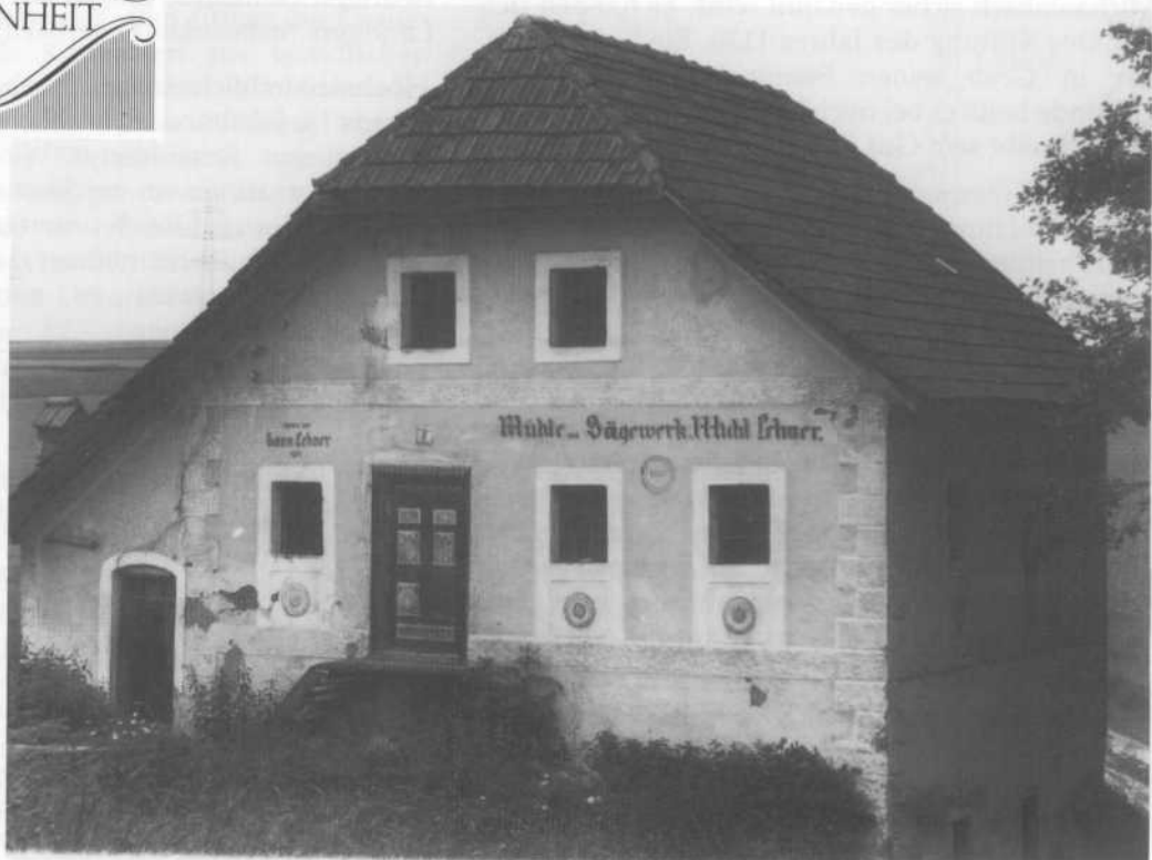
Die dem Verfall preisgegebene Mühle in Grub / 1980