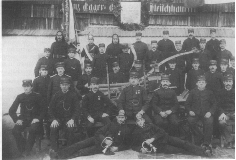
Die Ortsfeuerwehr um 1900 mit der Handspritze vor dem heutigen Gasthaus Schörgendorfer