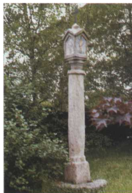
Restaurierte Pestsäule seit 1973 im Schulgarten