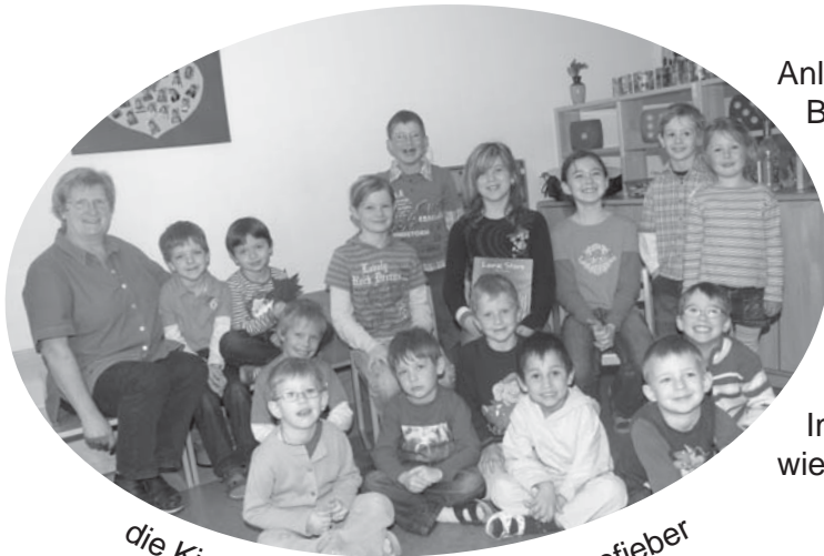
die Kindergartenkinder im (Vor)lesefieber

Anlässlich des „Welttag des Buches“ lud der Kindergarten Michaelnbach die Volksschüler zum Vorlesen ein. Alle vier Klassen beteiligten sich an diesem Projekt. Schüler und Kindergartenkinder waren hell auf begeistert. Im nächsten Jahr wird sicher wieder (vor)gelesen!