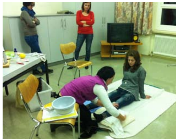
Das richtige Anlegen eines Wadenwickels

Wenn genügend Interessenten zusammenkommen, wird ein zweiter Kurs veranstaltet.